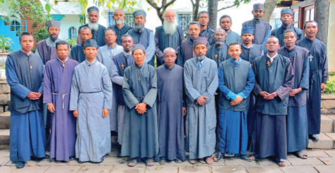
Ο Μητροπολίτης Β. Μαδαγασκάρης με τους ιερείς του