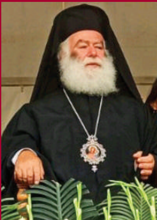
Η Α.Θ.Μ ο Πάπας & Πατριάρχης Αλεξανδρείας και πάσης Αφρικής κ.κ. Θεόδωρος Β΄.